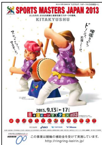
日本スポーツマスターズ PRリーフレット