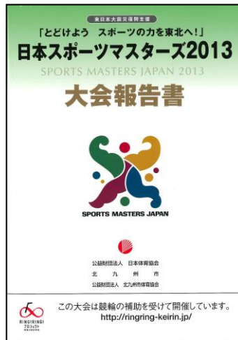
日本スポーツマスターズ 大会報告書